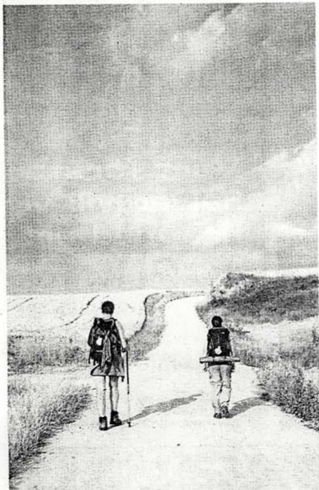
Vägen är lång och många gånger mödosam. Bitvis av vägen slog Katarina följe med andra.